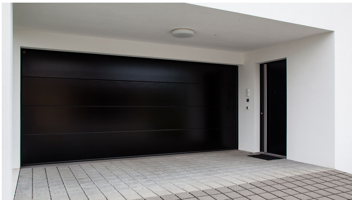
Garagen-Sectionaltor LPU, L-Sicke