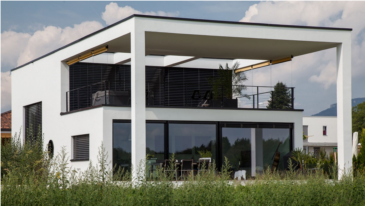
Einfamilienhaus W+W Minergie Haus