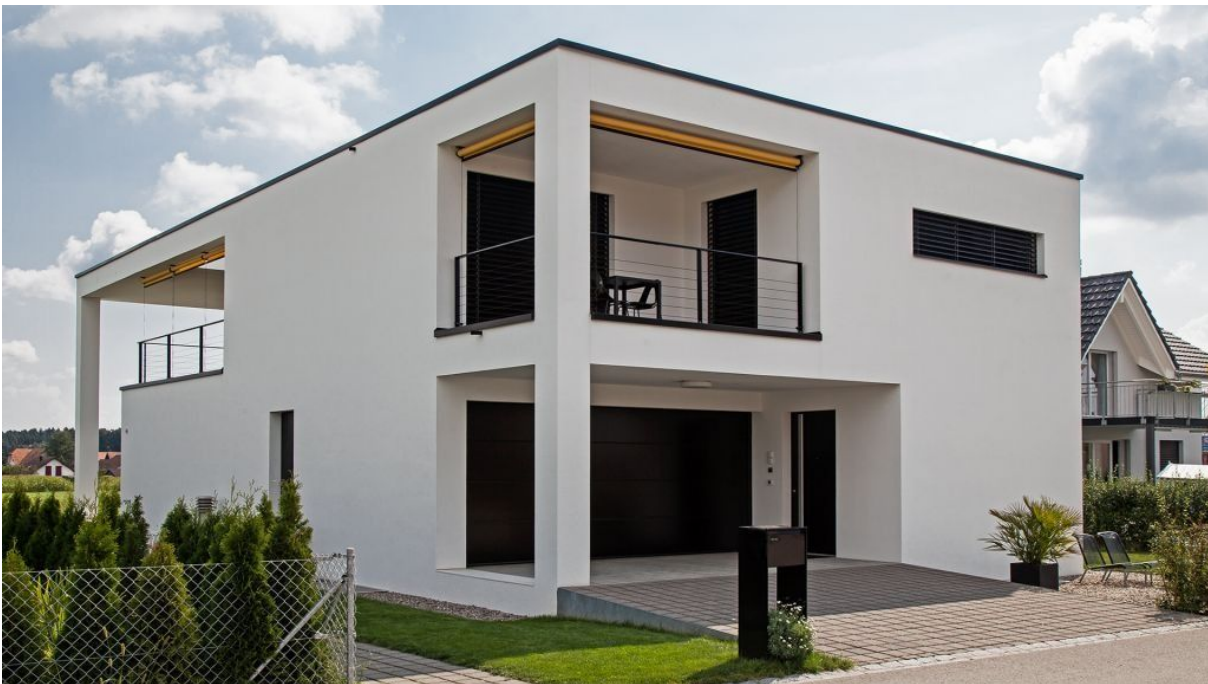
Garagen-Sectionaltor , Aluminium-Haustüre Minergie